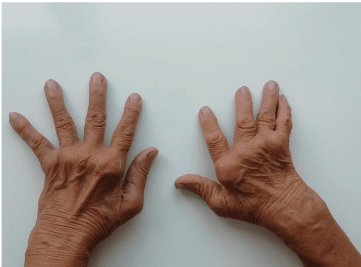
Fot. 1. Zmiany spowodowane reumatoidalnym zapaleniem stawów dłoni